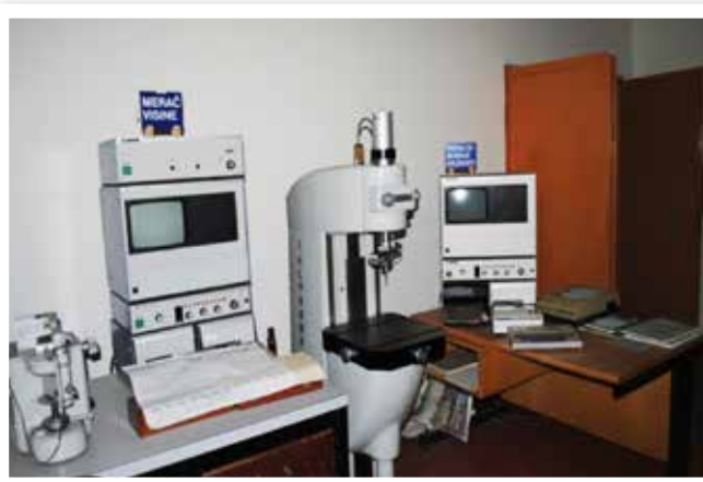
Машина за испитивање кружности и храпавости: HOBBSOON и TAYLOR (Енглеска)