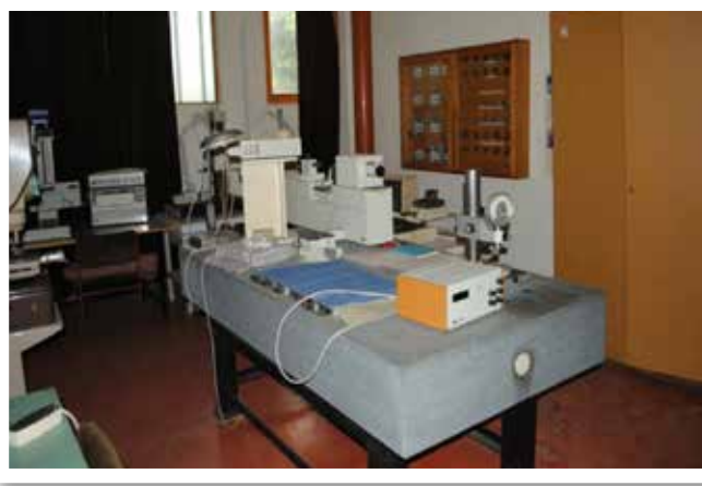
Машина за тродимензионално испитивање MITUTOYO Japan