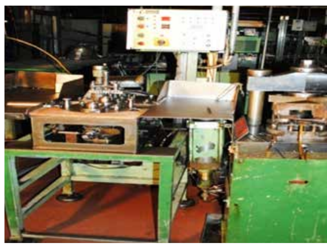
Машине за контролу, произвођач Институт "Михаило Пупин"